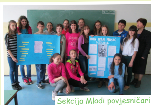
Sekcija Mladi povjesničari

Sve što je zabilježeno možemo zahvaliti na velikom trudu i radu naših učenika kao i učitelja.