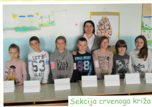
Sekcija crvenoga križa

ISKRE - List učenika Osnovne škole fra Didaka Buntića - MLADI KNJIŽNIČARI Kralja Tomislava 70, 88260 Čitluk Nakladnik: Osnovna škola fra Didak Buntić, Čitluk Za nakladnika: Marin Kapular, prof. Pokrovitelj lista: Općina Čitluk